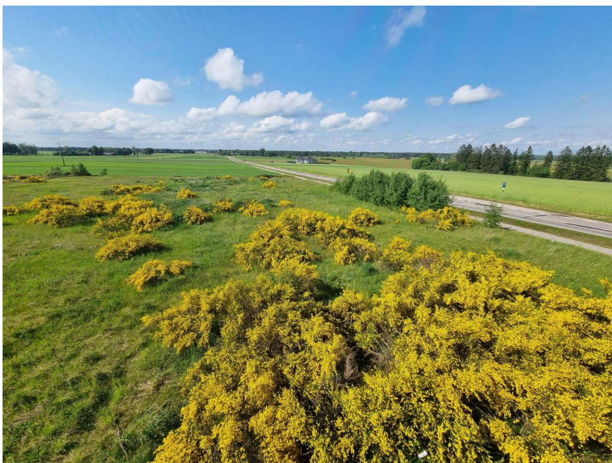
Widok z wieży w Pawlukach

Wypowiedź osoby uczestniczącej w badaniach