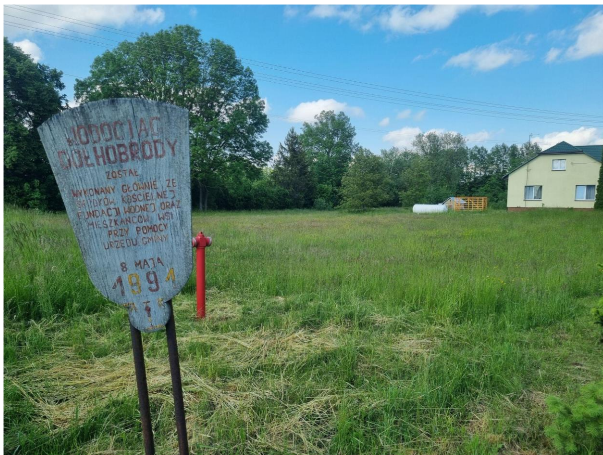
Tablica pamiątkowa w Dołhobrodach

przez jednego z mieszkańców. 8 Obecnie Muzeum już nie funkcjonuje, ale fakt dużego zainteresowania lokalnej społeczności swoją historią wart jest wzmocnienia w przyszłych działaniach.